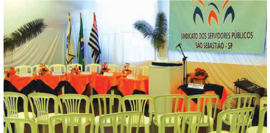
Preparativos para o debate