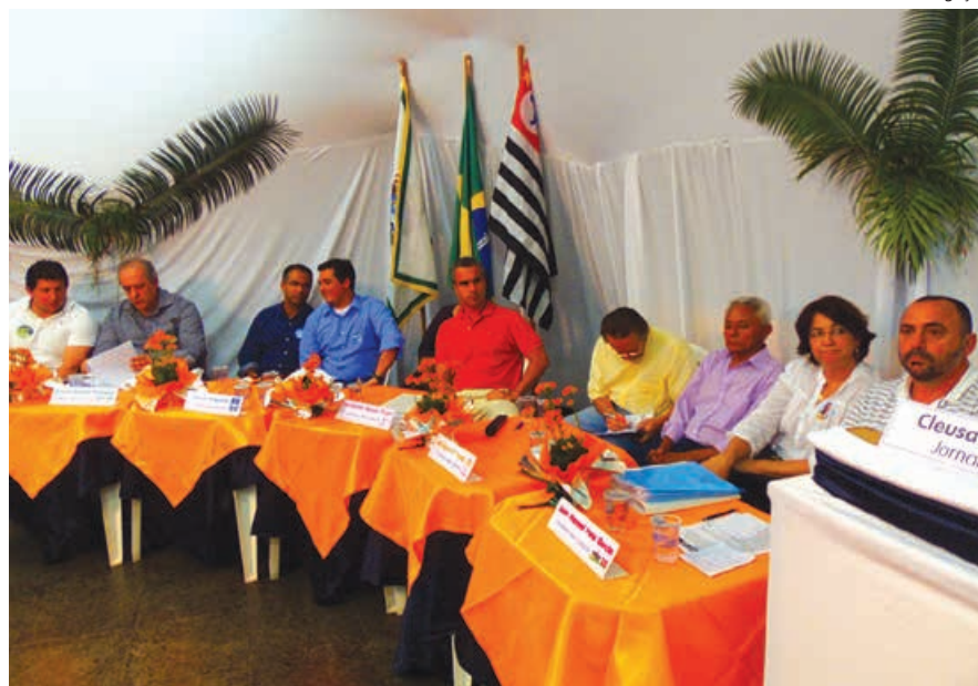
Candidatos durante o debate

O Sindserv - Sindicato dos Servidores Municipais de São Sebastião realizará no próximo dia 15 de agosto, quarta-feira, o primeiro debate com os candidatos a pre-