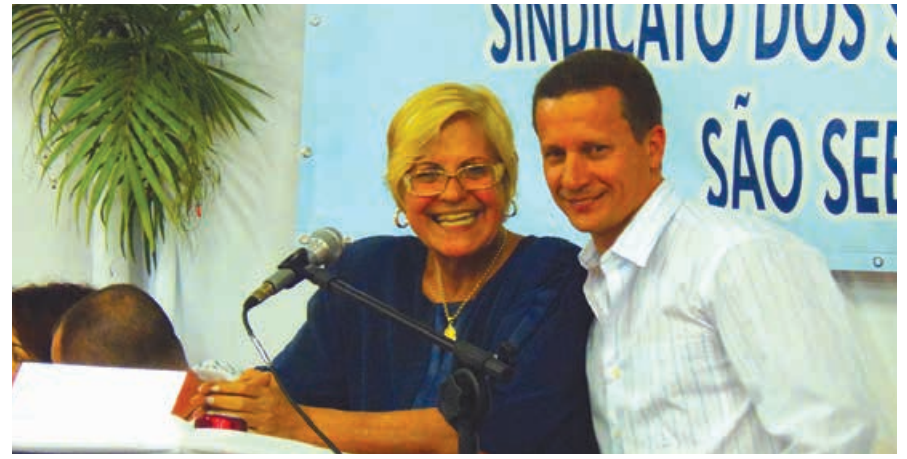
Presidente e mediadora durante o debate