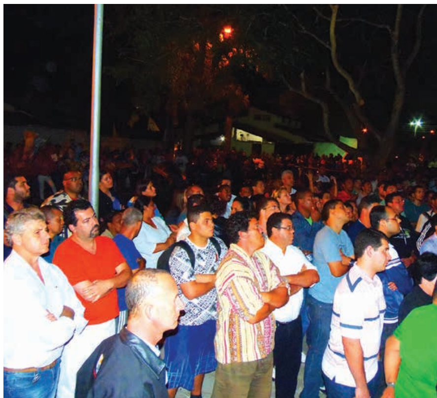
Público acompanha debate pelo telão no Sindserv