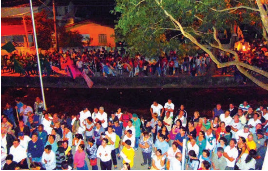
Público acompanha o debate pelo telão no Sindserv