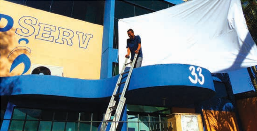
Preparativos para o debate