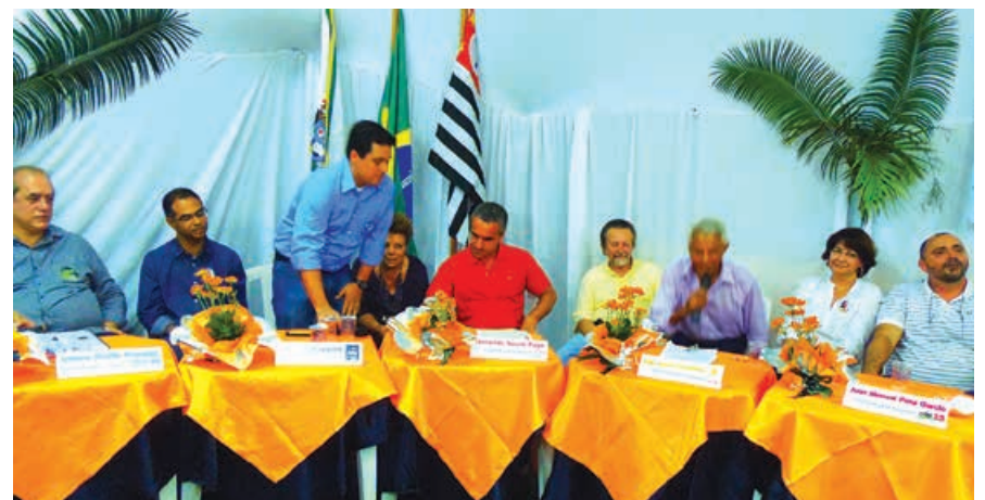
Todos os candidatos

Informação: O vídeo do debate, na sua íntegra, pode ser visto no site do sindicato: www.sindserv.com