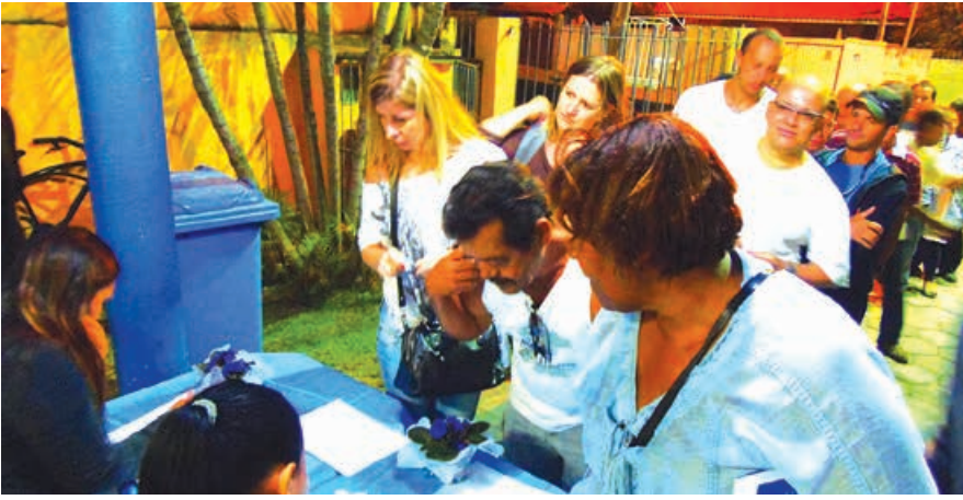
Servidores formam fila para entrada do debate